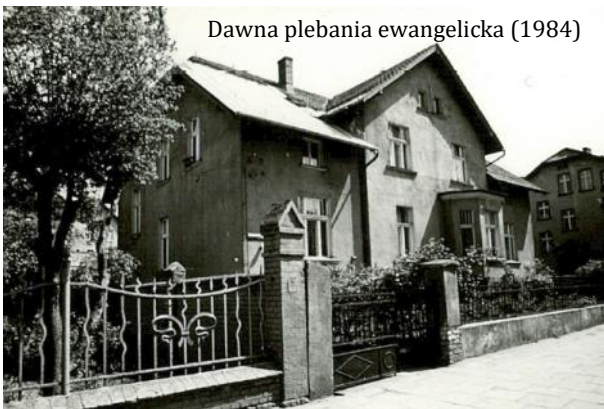
Dawna plebania ewangelicka (1984)

W 1940 roku parafia łącznie z filiałem w Zimowiskach obejmowała 5157 wiernych, a uestecki kościół skupiał 4277 ewangelików.