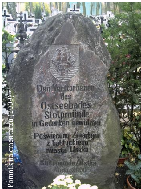
Pomnik na cmentarzu (2009)

stanie. W 2000 r. na cmentarzu odsłonięto pomnik upamiętniający zmarłych w Stolpmünde.