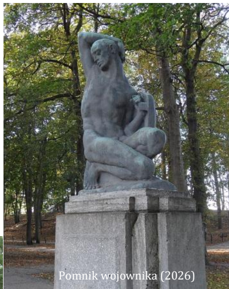
Pomnik wojownika (2026)

Do obecnych czasów z dawnych elementów architektury zachowała się kaplica ceglana oraz brama wejściowa o ceglanych słupkach i żeliwnych, ażurowych skrzydłach. Ciągłość pochówków pozwoliła na częściowe utrzymanie starodrzewu oraz na pozostawienie części pomników nagrobnych lub ich powtórne wykorzy-