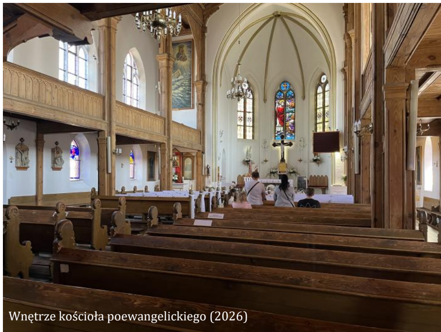
Wnętrze kościoła poewangelickiego (2026)

Stolp” napisano „Stary kościół został zastąpiony przez nowy budynek, którego wyposażenie pochodzi ze starego. W wieży znajduje się krucyfiks wykonany z drewna i pokryty lnianym płótnem. Na krzyżu jest wyryty rok Anno 1752, który prawdopodob-