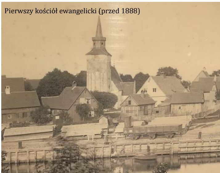
Pierwszy kościół ewangelicki (przed 1888)