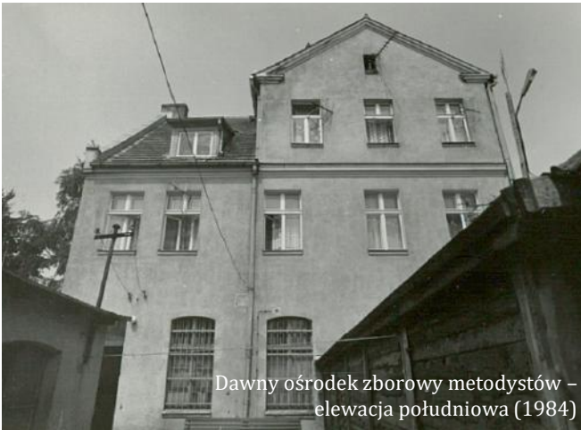
Dawny ośrodek zborowy metodystów – elewacja południowa (1984)

zakończeniu, okręg zborowy Słupsk – Ustka był obsługiwany przez pastora z Koszalina. Największy rozwój liczebny nastąpił pod koniec lat dwudziestych. W 1928 r. okręg liczył już 7 placówek, w tym 4 główne w: Ustce, Słupsku, Sławnie i Smołdzinie. Istniało 6 Szkółek Niedzielnych z około 250 dziećmi, 2 koła młodzieżowe (41 osób), 4 koła chóralne, 2 zespoły muzyczne. Okręg liczył wówczas: 40 członków próbnych, 102 członków pełnoprawnych i 56 dzieci.