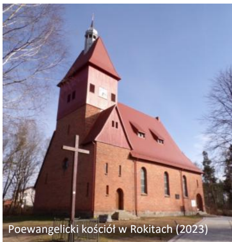
Poewangelicki kościół w Rokitach (2023)

Rokity (niem. Groß Rakitt, kasch. Wielżé Roczitzi) to duża wieś ok. 45 km na południowy wschód od Słupska i 26 km na północny wschód od Bytowa. Starsze formy nazwy to Rokitke (1377) i Rakitken (1601). Nazwa ma charakter topograficzny, pochodzi od „rokita”, czyli gatunku wierzby.