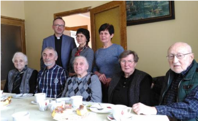
Uczestnicy nabożeństwa domowego w Pieskach (2018)