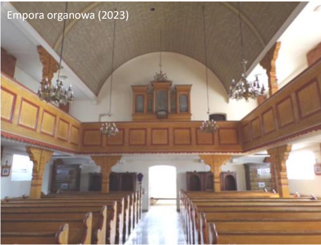
Empora organowa (2023)

Wyposażenie z czasów budowy kościoła: krucyfiks w prezbiterium, 2 świeczniki ołtarzowe, 2 świeczniki w formie aniołów trzymających kolumnę z profitką, empory, ławki, neogotycka chrzcielnica, prospekt organowy, witraż.