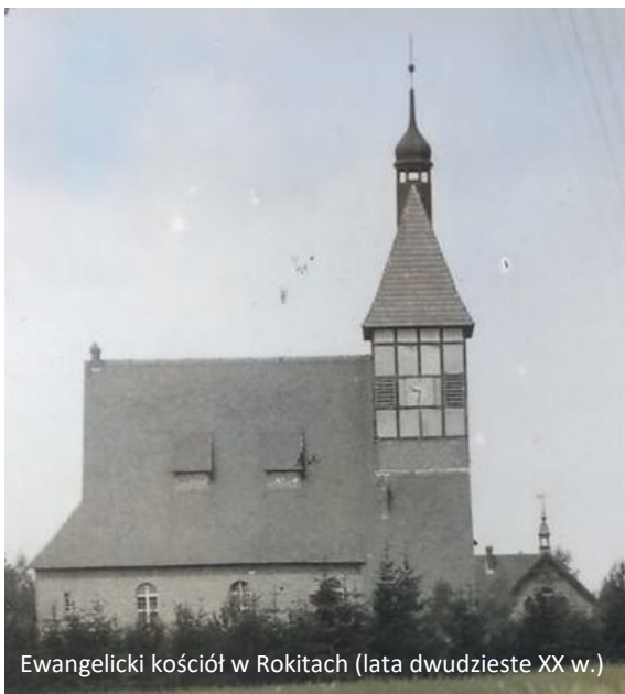
Ewangelicki kościół w Rokitach (lata dwudzieste XX w.)

Latem 1911 roku rozpoczęto budowę kościoła w Rokitach. 17 IX 1911 r. w obecnym prezbiterium wmurowano kamień węgielny. Cesarz Wilhelm II przekazał na budowę 20 000 RM, starosta powiatu słupskiego dr Walter von