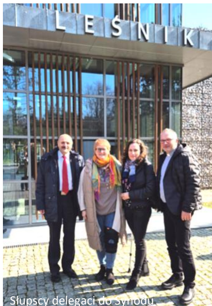
Słupscy delegaci do Synodu