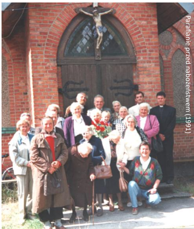
Parafianie przed nabożeństwem (1991)

nauka w Szkole Kadetów w Słupsku; 18 V 1799 - 6 III 1803 w Korpusie Kadetów w Berlinie; 1807-15 uczestnik wielu bitew w wojnach napoleońskich; 1825 szef sztabu VII Korpusu Armijnego; 26 II - 12 V 1849 deputowany do Niemieckiego Zgromadzenia Narodowego (Parlamentu) we Frankfurcie; od 1848 członek ewangelickiego Zakonu Joannitów; 1851-60 na emeryturze; 1816 przyjęty do loży masońskiej „Friedrich Wilhelm zum Eiser-