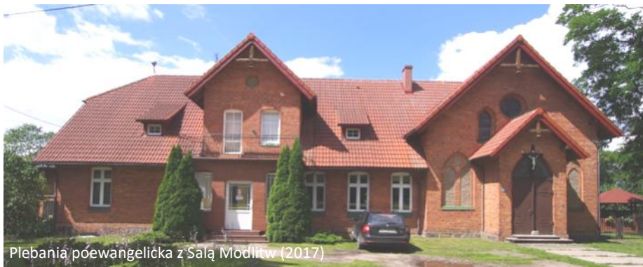
Plebania pówangeliicka z Salą Modlitw (2017)