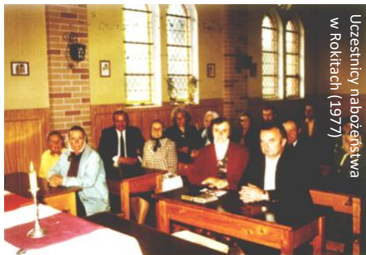
Uczestnicy nabożeństwa w Rokitach (1977)

23 VI 1971 r. władze PRL-owskie Decyzją nr Wz II-2/10a zapewniły zborowi ewangelickie-