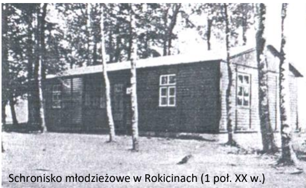
Schronisko młodzieżowe w Rokicinach (1 poł. XX w.)

Mühlenthal (do 1937 r. Wottnogge - Otnoga), Seeblick (do 1937 r. Saviat - Zawiaty), Eichen (do 1937 r. Dambee - Dąbie), Neurakitt (Rokiciny) i Bochow (Bochowko) w powiecie łębskim. W Rokicinach znajdowało się kościelne schronisko młodzieżowe z 30 łózkami.