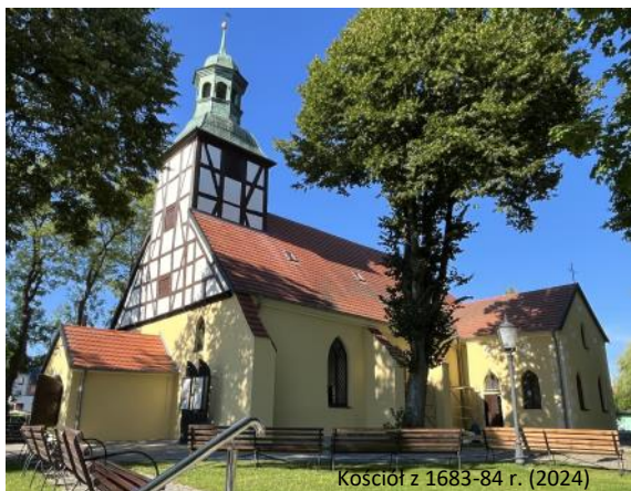
Kościół z 1683-84 r. (2024)

W maju 1946 roku władze państwowe przekazały kościół wspólnocie katolickiej. Po niewielkich przeróbkach, 19 V 1946 r. poświęcono go Wniebowzięciu Najświętszej Marii