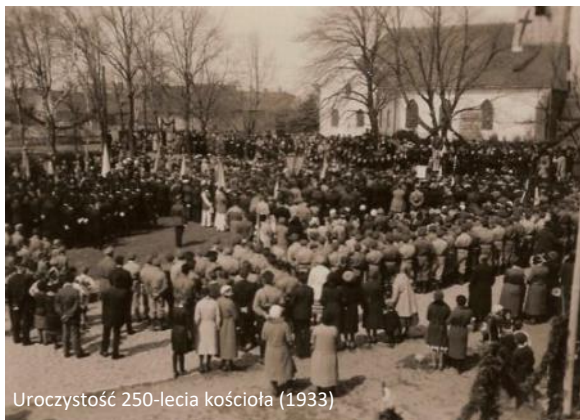
Uroczystość 250-lecia kościoła (1933)

30 kwietnia 1933 r. parafia świętowała 250-lecie kościoła. Na uroczystości przybył superintendent gene-