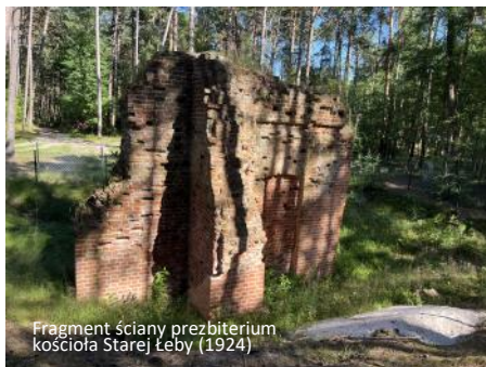
Fragment ściany prezbiterium kościoła Starej Łeby (1924)

W latach 1360-62 z fundacji Krzyżaków na miejscu drewnianego kościółka wzniesiono świątynię, której patronem został św. Mikołaj. Obiekt zbudowano z cegieł gotyckich, murywanych na zaprawie wapiennej. Z tego okresu pochodzi przekaz o kulcie dorsza, którego srebrna figurka zajmowała centralne miejsce w świą-