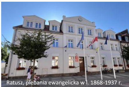
Ratusz, plebania ewangelicka w l. 1868-1937 r.