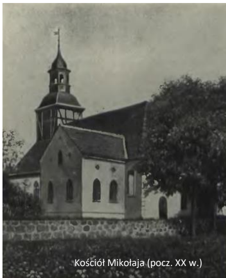
Kościół Mikołaja (pocz. XX w.)

Łeba (kaszub. Łeba, niem. Leba) – miasto w pow. lęborskim, położone na Wybrzeżu Słowińskim, nad rzekami Łebą i Chelstem, miejscowość wypoczynkowa z portem morskim i kąpieliskami.