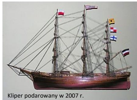
Klipper подарowany w 2007 r.

czasach ewangelickich była jeszcze empora nad zachodnią częścią nawy. Aby uhonorować ewangelickiego artystę, autora obrazu Matki Bożej, przed kościołem ustawiono ławkę Pechsteina w kształcie palety malarzkiej. Obok świątyni stoi również obelisk, upamiętniający parafian poległych w czasie I wojny światowej. Ważnym elementem wyposażenia kościoła w czasach ewangelickich był trójmasztowy żaglowiec z 1870 r.,