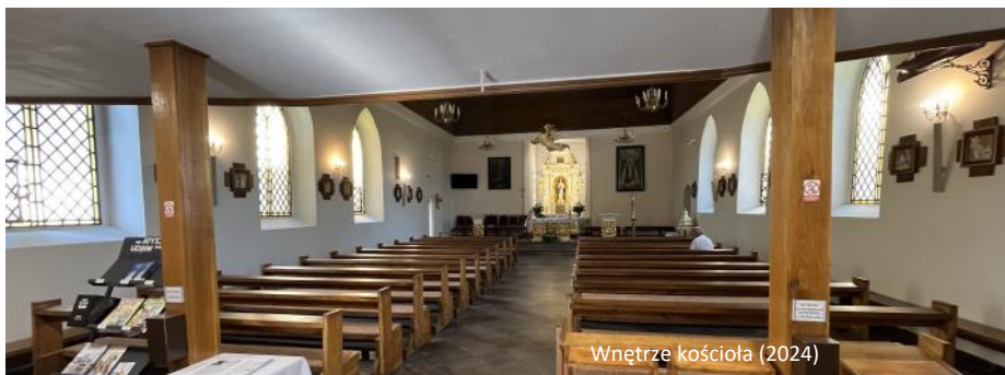
Wnętrze kościoła (2024)