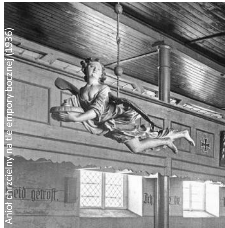
Anioł chrzcielny na tie empory boczne (1936)

wożeńcom obrączki. Nad wejściem znajduje się empora z organami. W