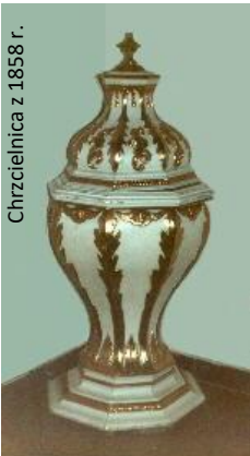
Chrzcielnica z 1858 r.

Nawę przykrywa drewniany strop o przekroju trapezu. Barokowy ołtarz ocalał z poprzedniego kościoła. Na ścianie z lewej strony prezbiterium wisi obraz Madonny M. Pechsteina, natomiast z prawej strony – obraz z wizerunkiem św. Mikołaja. Z lewej strony nawy stoi drewniana chrzcielnica z 1858 r., wykonana przez Friedricha Lawrenza.