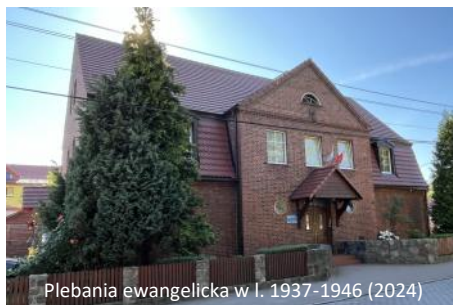
Plebania ewangelicka w l. 1937-1946 (2024)