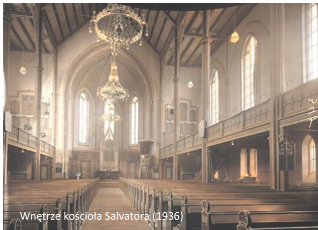
Wnętrze kościoła Salvatora (1936)

Kościół składa się z potężnego korpusu i pięciobocznego prezbiterium przyległego do nawy środkowej oraz równej mu szerokością wieży zachodniej. Wystrój elewacji nawiązuje do kościoła ap. Jakuba: ślepe, tynkowane, łukowate blendy oraz ślepe okulusy obiegające ściany prezbiterium. Wnętrze organizują typowe ewangelickie empyry wstawione