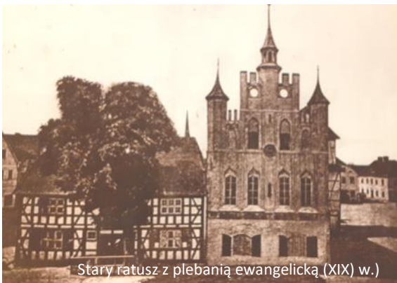
Stary ratusz z plebanią ewangelicką (XIX) w.)

30x50 m). Sala modlitw wykorzystywana była także do celów pozakulturowych, odbywały się w niej sejmiki,