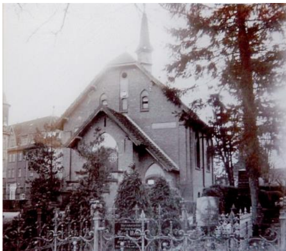
Kaplica cmentarna z 1870 r.

W Lęborku ewangelikom pozostawiono cmentarz i kaplicę przedporzebową. W latach pięćdziesiątych czynny cmentarz zlikwidowano i utworzono na jego miejscu park. Kaplica cmentarna zaczęła pełnić rolę głównego kościoła ewangelickiego.