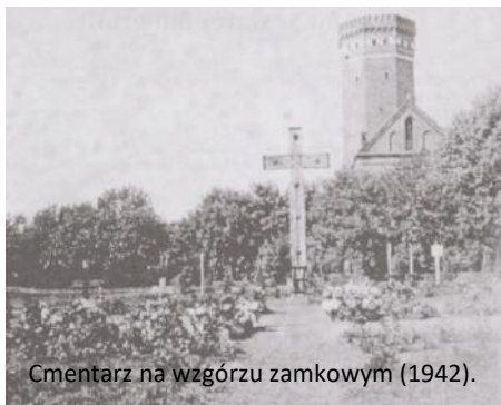
Cmentarz na wzgórzu zamkowym (1942).

Po zakończeniu wojny cmentarz uległ stopniowej dewastacji. W 1973 r. został zniwelowany, wykarczowano krzewy, usunięto resztki płyt i symboli nagrobnych. W części terenu