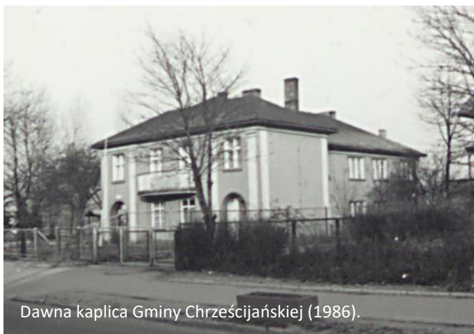
Dawna kaplica Gminy Chrześcijańskiej (1986).

Po 1945 r. kościół zamieniono na salę widowiskową, kino, salę muzealną. W