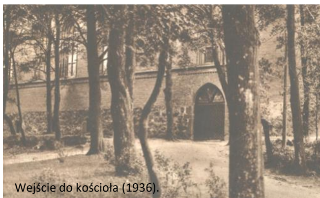
Wejście do kościoła (1936).