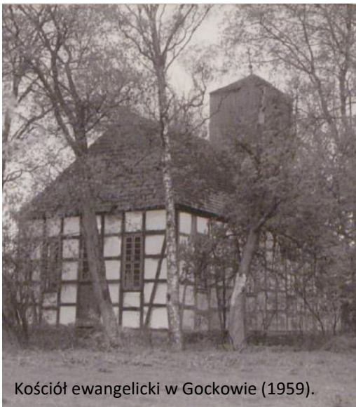
Kościół ewangelicki w Gockowie (1959).

Po 1945 r. człuchowski ewangelicyzm zszedł do podziemia. Legalizacja nabożeństw luterzańskich nastąpiła dopiero w 1952 r. w wiejskim kościele w Gockowie. Władze wojewódzkie w