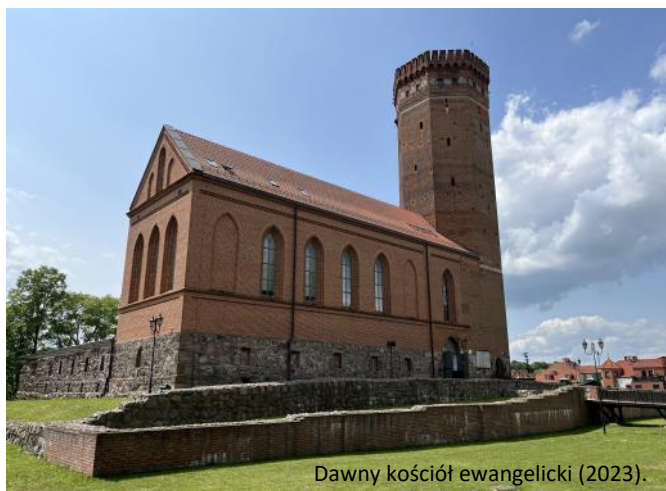
Dawny kościół ewangelicki (2023).