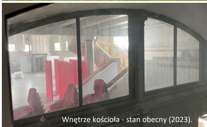
Wnętrze kościoła - stan obecny (2023).