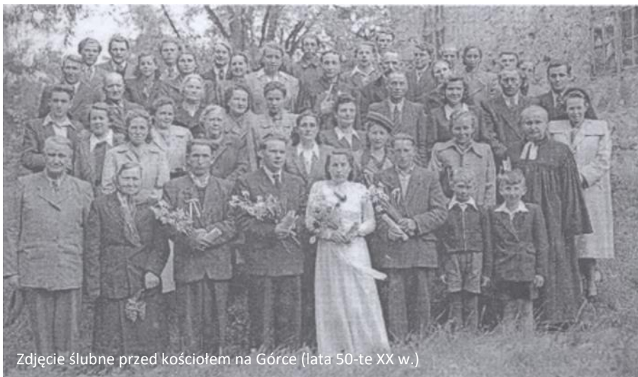
Zdjęcie ślubne przed kościołem na Górcze (lata 50-te XX w.)