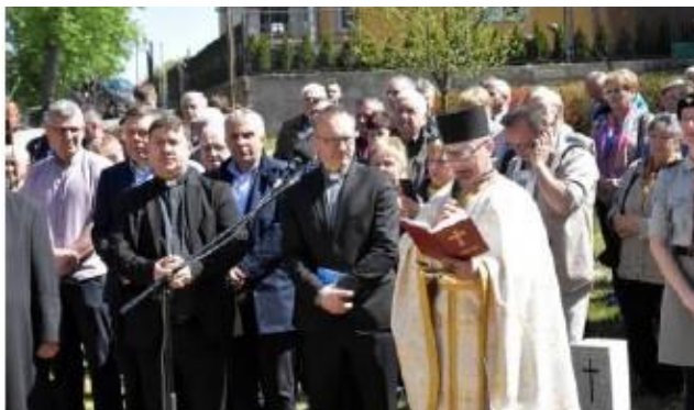
Uroczystość na dawnym cmentarzu ewangelickim przy byłym kościele na Górcie (2019)