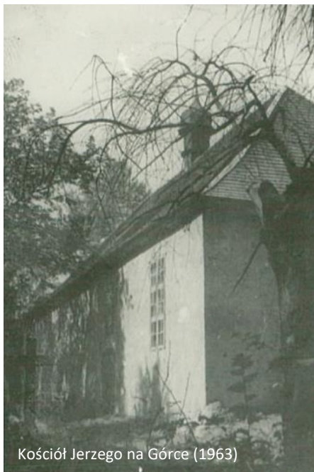
Kościół Jerzego na Górcze (1963)

Wykorzystał to Kościół Metodystyczny, posyłając swoich pastorów na Pomorze. Przekonywali oni autochtonów, że ich Kościół jest bliższy Kościołowi Unijnemu od Kościoła ewangelicko-augsburskiego, który zawsze podkreślał swój wybitnie luteranski charakter. W swej pracy na Pomorzu metodyści upodobnili się do zwyczajów nabożeństwa ewangelickiego, na przykład w obchodzie Komunii Świętej, czy przyrzeczeniu konfirmacyjnym, posługiwali się także katechizmami Marcina Lutera, a duchowni używali ewangelickich strojów liturgicznych. Pomimo intensywnej działalności,