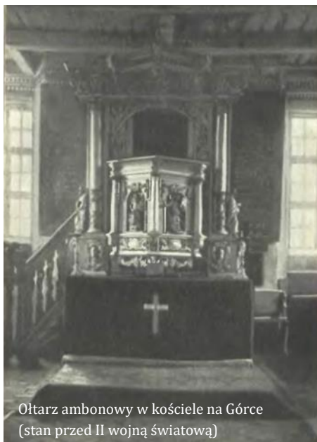
Ołtarz ambonowy w kościele na Górcie (stan przed II wojną światową)

Po I wojnie światowej bytowską społeczność ewangelicką podzielono na dwa zbory: zachodni (przy kościele św. Jerzego), do którego obok zachodniej części Bytowa należały też Dąbie, Gost-