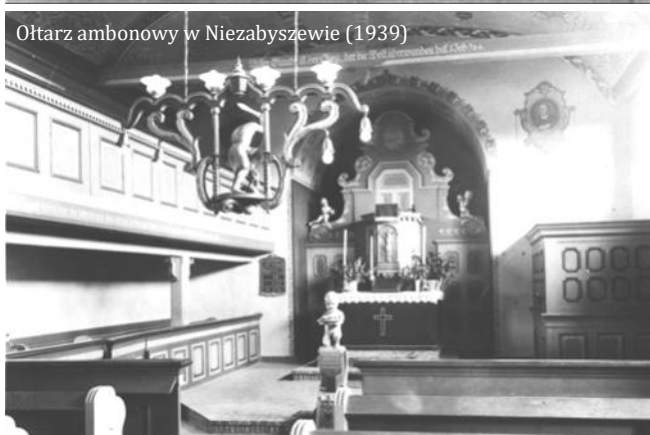
Ołtarz ambonowy w Niezabyszewie (1939)