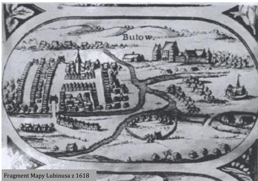
Fragment Mapy Lubinusa z 1618

W 1673 r. kościół uległ zniszczeniu z powodu huraganu. W latach 1675-85 obiekt odbudowano do