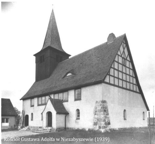
Kościół Gustawa Adolfa w Niezabyszewie (1939)

W przebudowanych budynkach niezabyszewskiego kościoła i plebanii mieści się obecnie Szkoła Podstawowa im. marszałka Józefa Piłsudskiego.