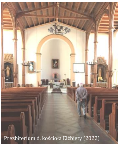
Prezbiterium d. kościoła Elżbiety (2022)

Od wybudowania, aż do 1945 r. obiekt funkcjonował jako ewangelicki kościół im. Elżbiety (niem. Elisabethkirche). Po II wojnie światowej przejęli go katolicy i zmienili nazwę na św. Katarzyny. Na uwagę zasługują empory, organy z 1854 r. oraz dwa dzwony z lat