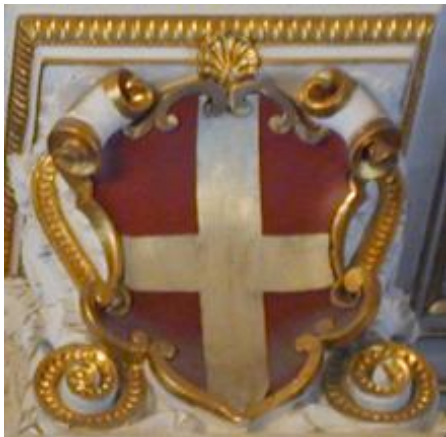
Herb biskupa kamieńskiego od XVI

struktur Pomorskiego Kościoła Ewangelickiego; 1544 mianowany superintendentem kołobrzeskim; 5 V 1545 instalacja na biskupa kamieńskiego; podejmował zabiegi o przyjęcie Pomorza do unii