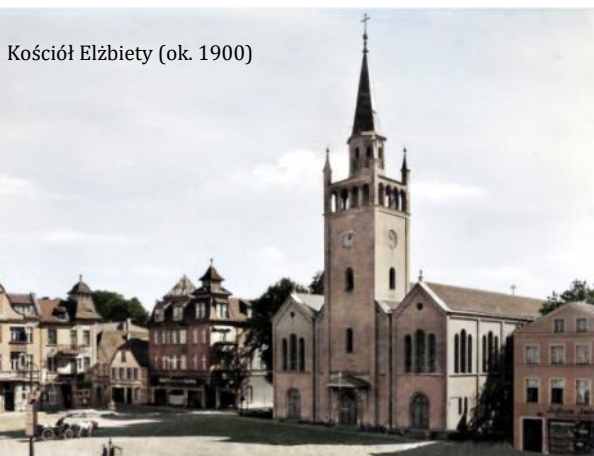
Kościół Elżbiety (ok. 1900)