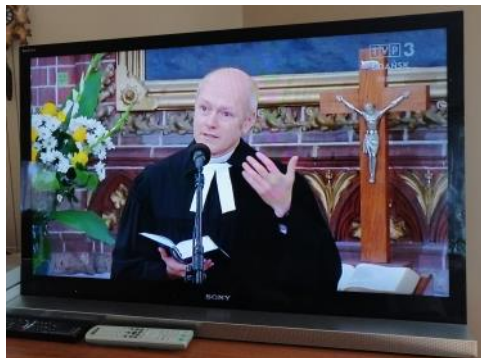
Szczecin, 26 kwietnia 2020 - TVP 3