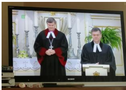
Wrocław, 29 marca 2020 - TVP3