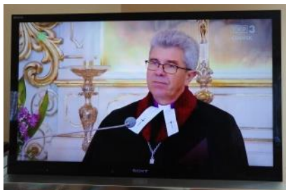
Pszczyna, 5 kwietnia 2020 Niedziela Palmowa - TVP3