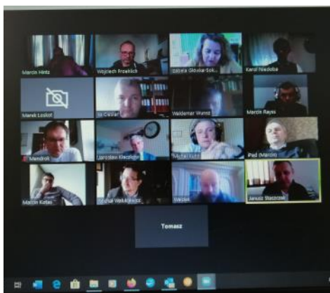
Diecezjalna Konferencja Duchownych 5 maja 2020