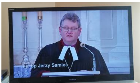
Lublin, 22 marca 2020 - TVP3