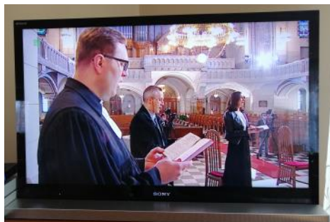
Łódź, 10 kwietnia 2020 - TVP 3 Wielki Piątek