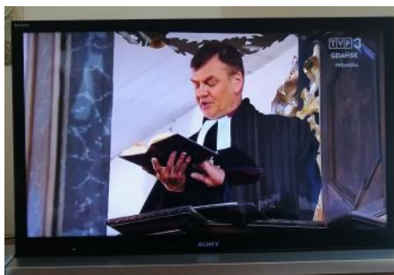
Pasym, 10 maja 2020