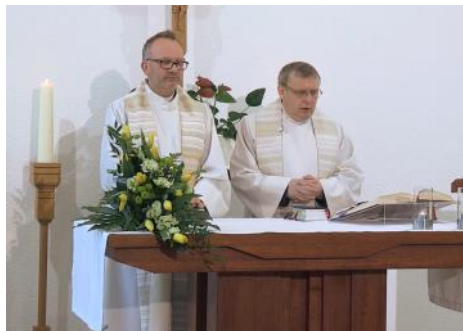
Koszalin 12 kwietnia 2020 Wielkanoc