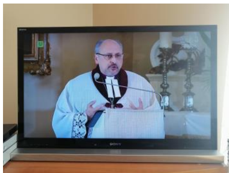
Goleiszów, 12 kwietnia 2020 Wielkanoc - TVP3