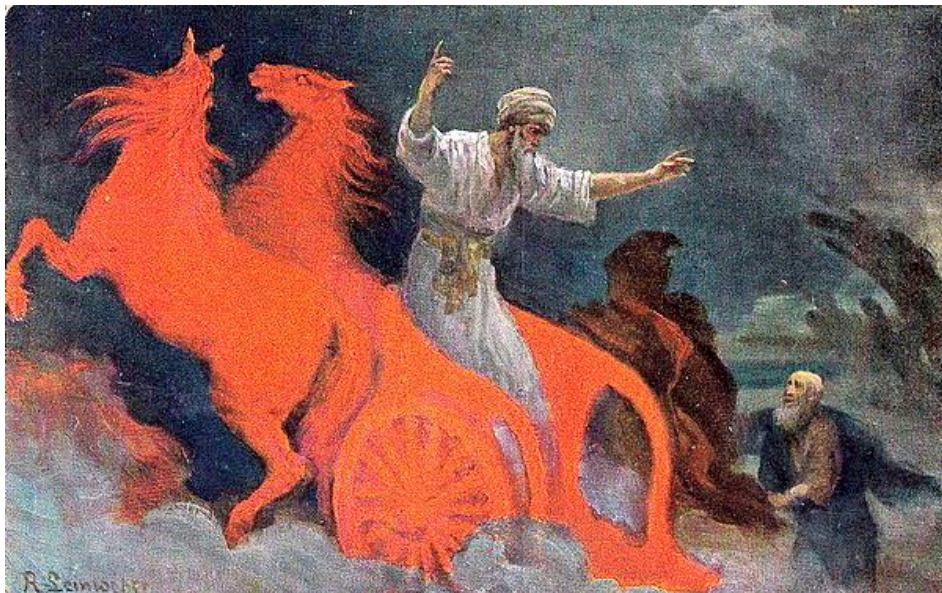
Wniebowzięcie Eliasza na ognistym rydwanie 2. Krl 2

Jezusa. Nikt inny jak osoba boska nie mógłby wstąpić do nieba. O Eliaszu czy Henochu napisane jest, że zostali wzięci do nieba, a więc była to Boża ingerencja. Pomijając nasze ewangeliczne podejście do tematów maryjnych, kościół rzymskokatolicki uznaje dogmat z 1854 roku, że Maria także została wzięta do nieba. Tylko Jezus WSTĄPIŁ – bez niczyjej ingerencji, powrócił tam skąd przyszedł. To spoglądanie w niebo, za wstępującym tam Jezusem, jest dla nas początkiem oczeki-