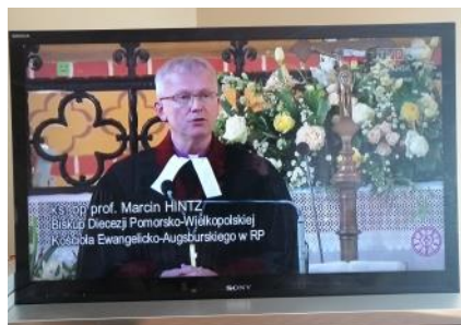
Bydgoszcz, 3 maja 2020 - TVP3