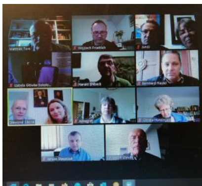
Spotkanie polsko-niemieckiej grupy roboczej - Zoom 29 kwietnia 2020

Szkołki niedzielne dla dzieci oraz rekolekcje pasyjne przygotowane przez ChTI (Chrześcijańska Telewizja Internetowa)