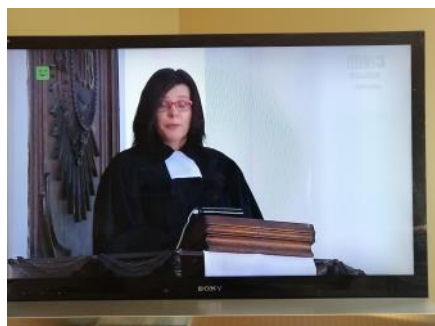
Radom, 19 kwietnia 2020 TVP 3